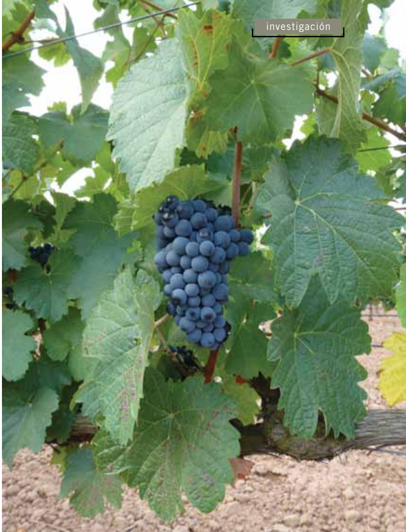
Cepa de Maturana Tinta de Navarrete.