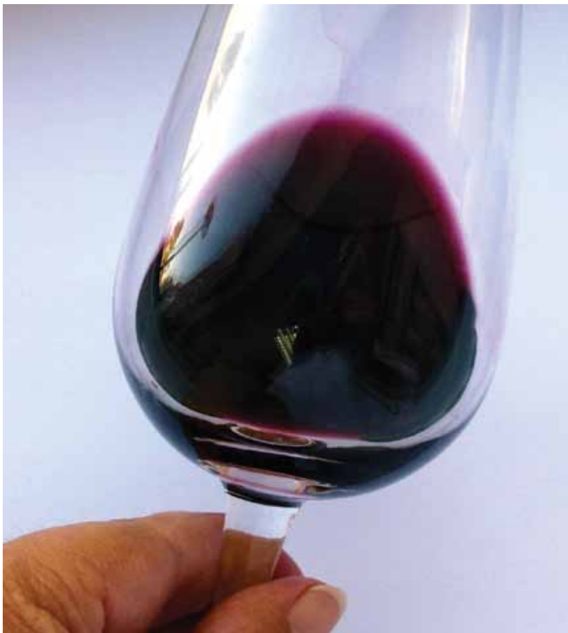
Vino de Maturana Tinta de Navarrete.

perimental con dichas variedades, y se llevó a cabo el estudio de su comportamiento vitícola y enológico en condiciones comparativas, ya que los resultados previos se obtuvieron en los viñedos en los que las variedades fueron recuperadas, y por tanto en condiciones de cultivo muy variables.