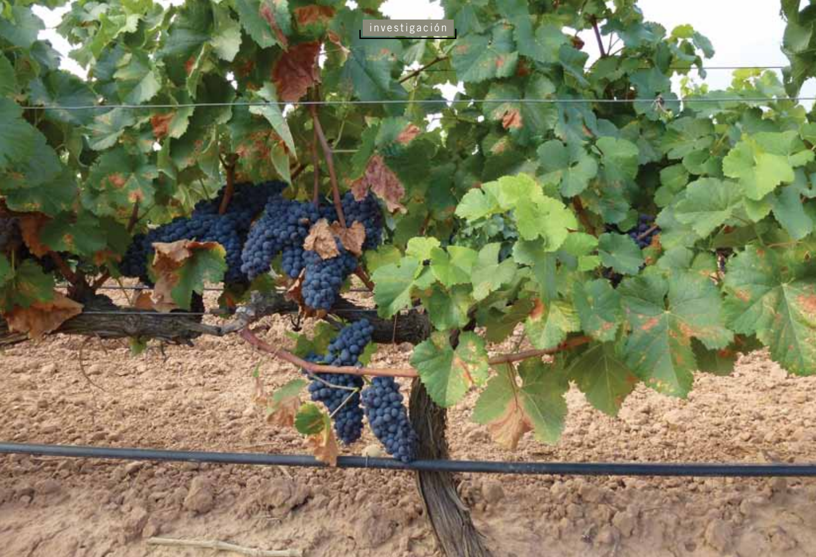
Cepa de Maturana Tinta.

ratorio del Instituto Madrileño de Investigación y Desarrollo Rural, Agrario y Alimentario (IMIDRA), mediante la utilización de 24 microsatélites. Los resultados obtenidos confirmaron las sinonimias entre Maturana Tinta y Merenzao, y entre Monastel de Rioja y Moristel. Sin embargo, el material denominado Maturana Tinta de Navarrete no tuvo similitud con ninguna de las variedades de la Finca El Encín, que alberga la colección de variedades de vid más importante y amplia de España. Recientemente, en 2011, esta variedad fue identificada mediante microsatélites en el INRA de Montpellier como sinonimia de la variedad Castets, cultivada en una superficie muy reducida (2 ha) en la región francesa de La Gironde.