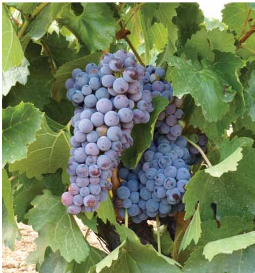
Racimo de Monastel.