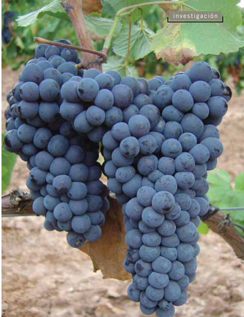
Racimo de Maturana Tinta.

molecular se muestra en la figura 1. Estos compuestos participan en las características gustativas del vino (acidez, astringencia, amargor y estructura) y se consideran de gran interés por sus propiedades saludables, especialmente por su importante actividad antioxidante, actuando en la prevención de los procesos degenerativos de la salud